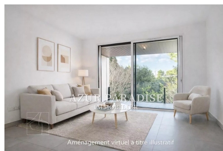
Aménagement virtuel à titre illustratif